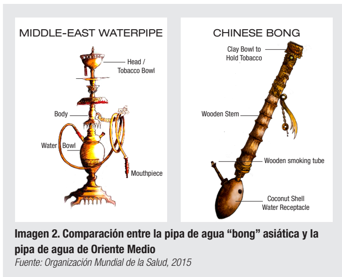
Imagen 2. Comparación entre la pipa de agua “bong” asiática y la pipa de agua de Oriente Medio